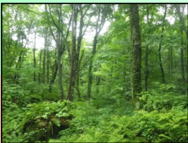
白神山地のブナ林