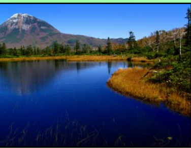
知床の三の沼と羅臼岳