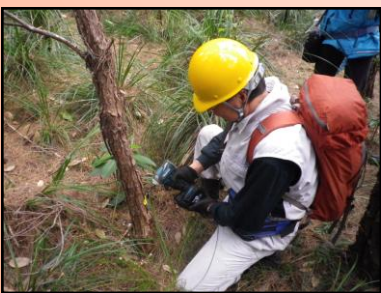
小笠原での外来種(モクマオウ)駆除