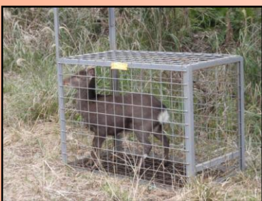
ヤクシカの有害鳥獣捕獲

日本の「世界自然遺産」は、平成五年一月に屋久島と白神山地、平成一七年七月に知床、平成二三年六月に小笠原諸島が世界遺産一覧に登録され、現在4地域になりました。特に、小笠原諸島が世界自然遺産に登録された際には、多くの報道機関で紹介され唯一の交通機関である片道二五時間半のおがさわら丸は毎航海混雑した状況が続いています。 四地域では、その顕著な普遍的価値の保護及び保全管理していくための取り組みが進められていますが、それぞれに課題があります。 日林協では、平素から世界自然遺産と係わりのある業務を実施していることから、これまで関係してきた行政、有識者の皆様とともに各地域の課題と取り組みを整理し、世界自然遺産という優れた自然を後世に残すために今何が求められているかを考えるとともに、その現状と課題に関する情報の共有を図るための公開シンポジウムを開催することとしました。